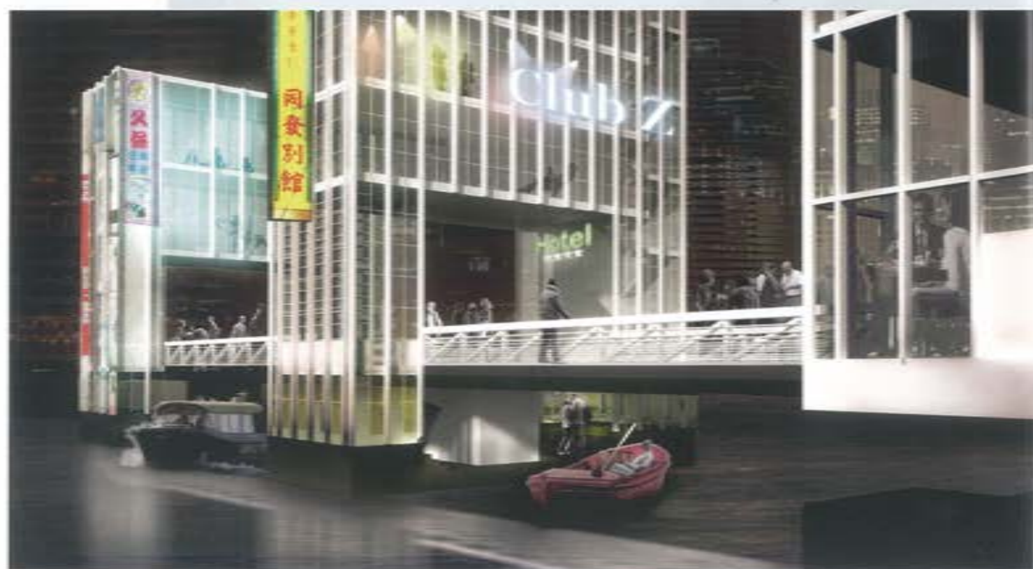
↗ Rijnhavenbrug prijsvraagontwerp Bureau 205