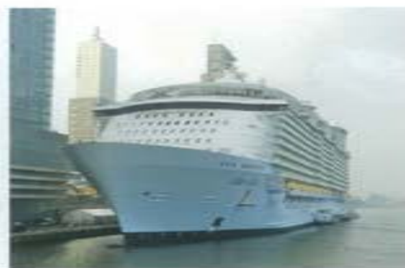
← Oasis of the Seas