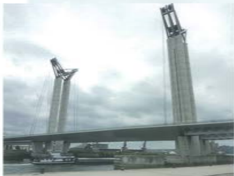
→ Gustave Flaubert Bridge Rouen