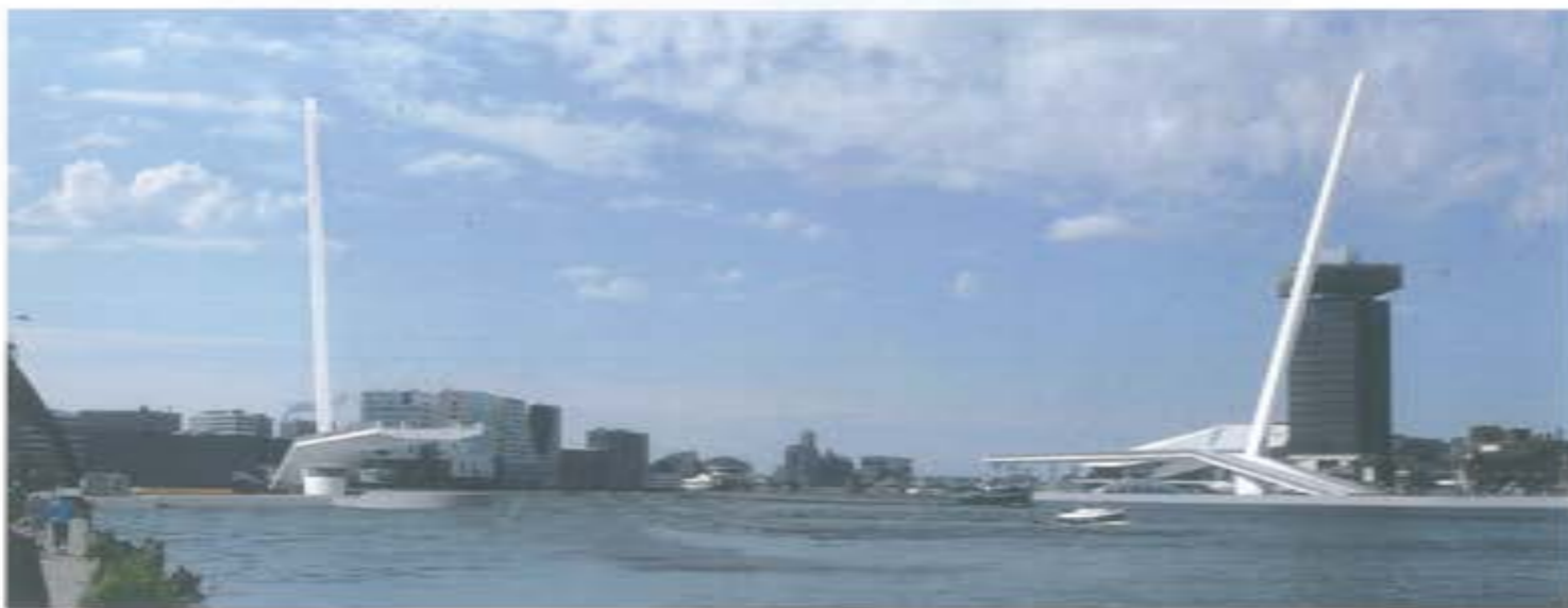
↑ Deververbinding over het IJ. dubbele draaibrug inzending team CS

moelingsbelaste toepassingen zoals wegverkeersbruggen is tot voor kort tegengehouden omdat onvoldoende beproevingen zijn uitgevoerd met simulatie van werkelijke wielasten. De Gemeente is daarbij zeer beducht voor de introductie van een generatieprobleem, zoals die zich heeft gemanifesteerd bij de vermoeingsweerstand van stalen orthotrope dekken daterend van voor 1990 in het Rijkswegennet. Immers de praktijk leert dat als er één schaap over de dam is, andere opdrachtgevers min of meer blind zullen volgen.