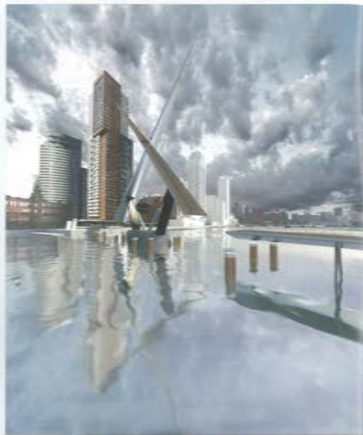
←→ Claasbrug Dordrecht prijsvraagontwerp René van Zoik architecten