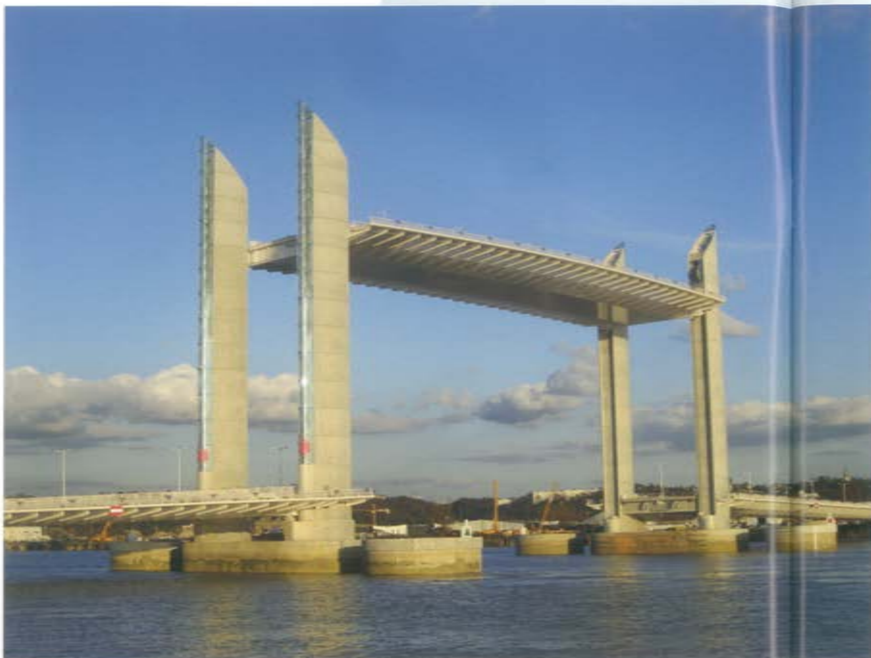
→ Chaban-Delmas brug, Bordeaux (doorvaartbreedte 106 m, hoogte 53 m)