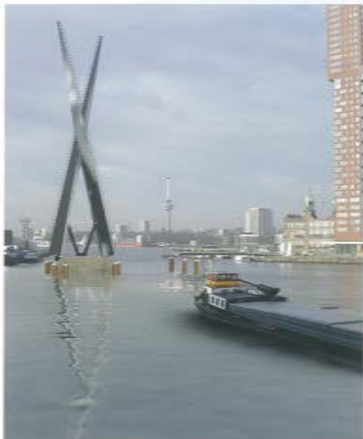
↑ Rijnhavenbrug (prijsvraagontwerp bureau SLAI)